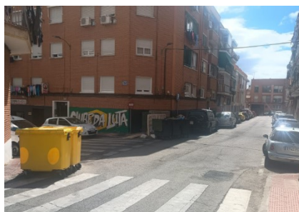
Calle San Nicolás donde se acumulan y desbordan contenedores